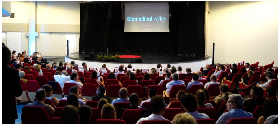
Workshop + cena in villa

TED x Mirandola x = independently organized TED event