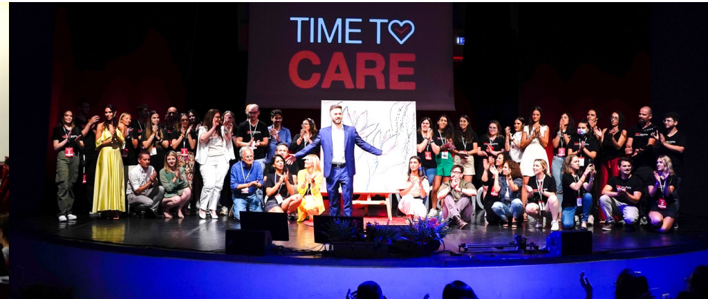
Evento + aperitivo